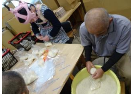
抽選会用新米準備